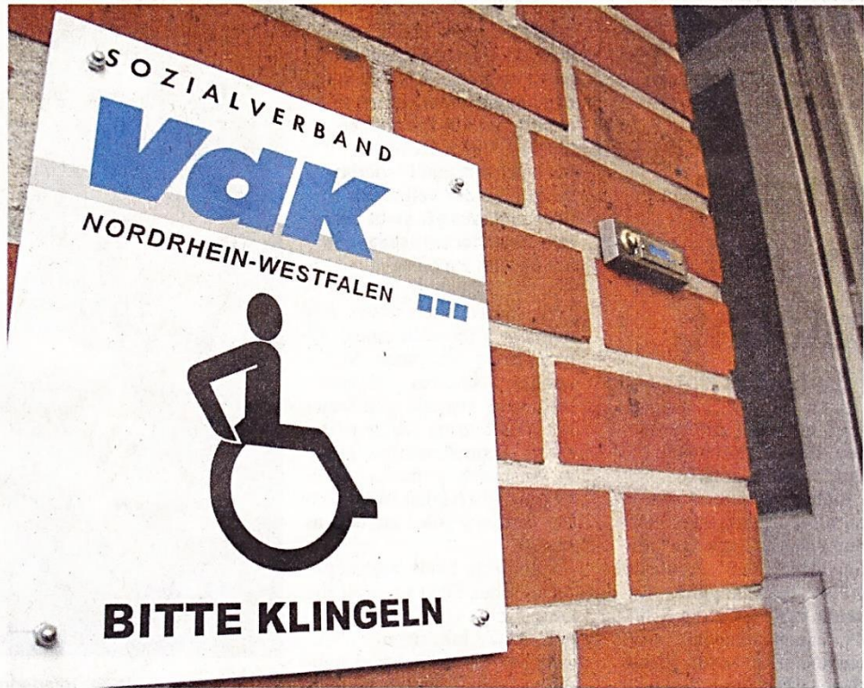
Die neue VdK-Kreisgeschäftsstelle ist Anlaufstelle für Menschen mit Behinderungen, für chronisch Kranke, Senioren, Patienten und Arbeitslose.