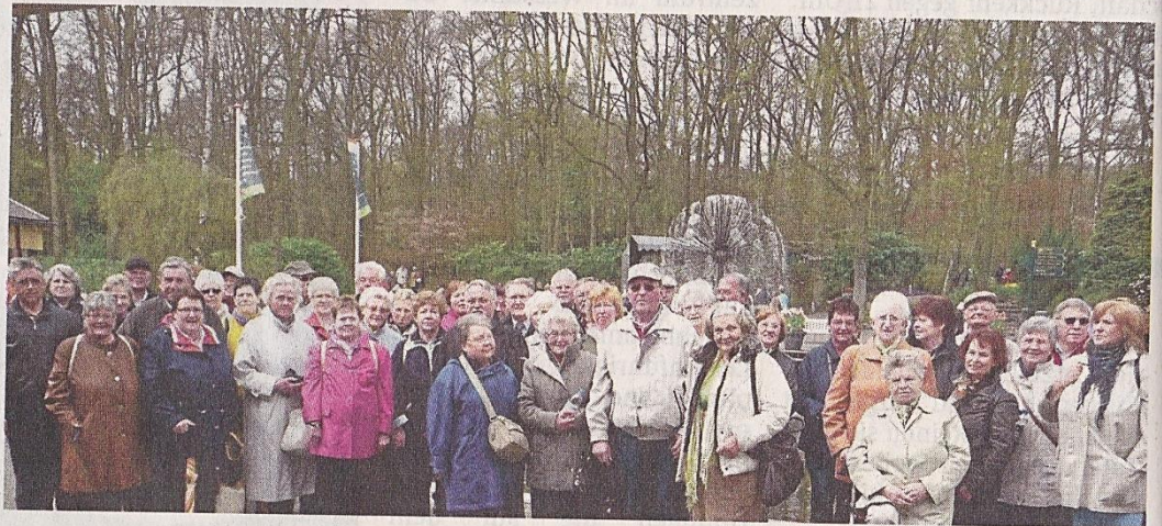
Auf die Teilnehmer der Fahrt des VdK warteten im Keukenhof viele Eindrücke.