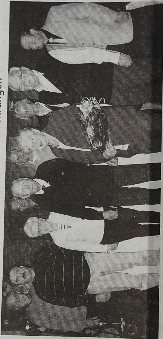
Zahlreiche langjährige und verdiente Mitglieder konnten sich am vergangenen Samstag beim VdK in Stadtlohn über eine Ehrung freuen.