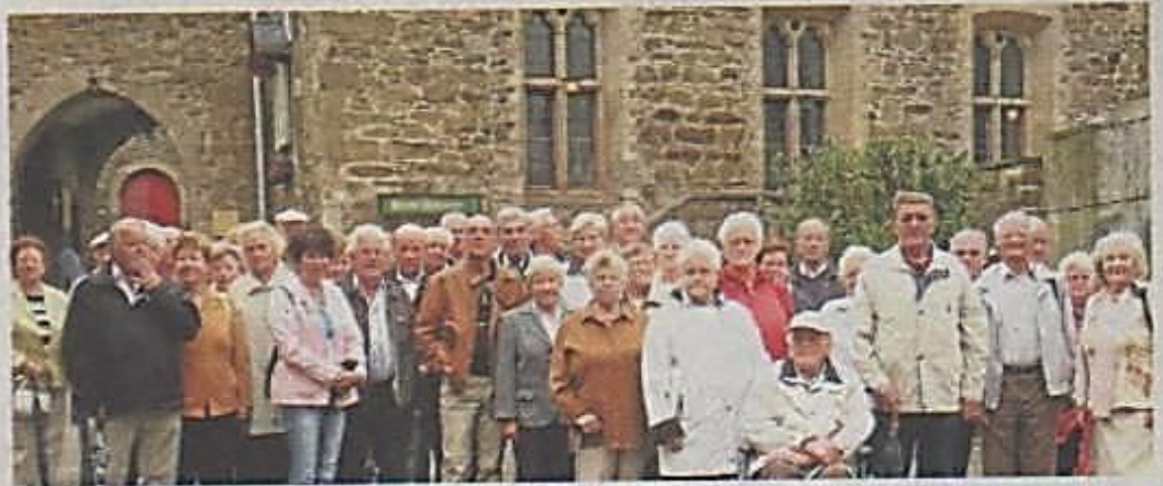
Viele neue Eindrücke mitbringen konnten die Teilnehmer einer Fahrt ins Bergische Land, die der VdK-Ortsverband Stadtlohn organisiert hatte.

Stadtlohn • Eine unterhaltsame Fahrt ins Bergische Land hat jetzt beim VdK-Ortsverband Stadtlohn auf dem Programm gestanden. Die Teilnehmer besuchten den Altenberger Dom. Später ging es zum Schloss Burg, wo Kaffee und Kuchen serviert wurde. Die Besichtigung der Müngstener Brücke fiel jedoch aus: Die Teilnehmer zollten mit diesem Entschluss der schlechten Witterung Tribut.