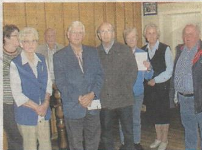
Bei der Jahreshauptversammlung des VdK-Ortsverbands Stadtlohn konnten viele Jubilare geehrt werden.