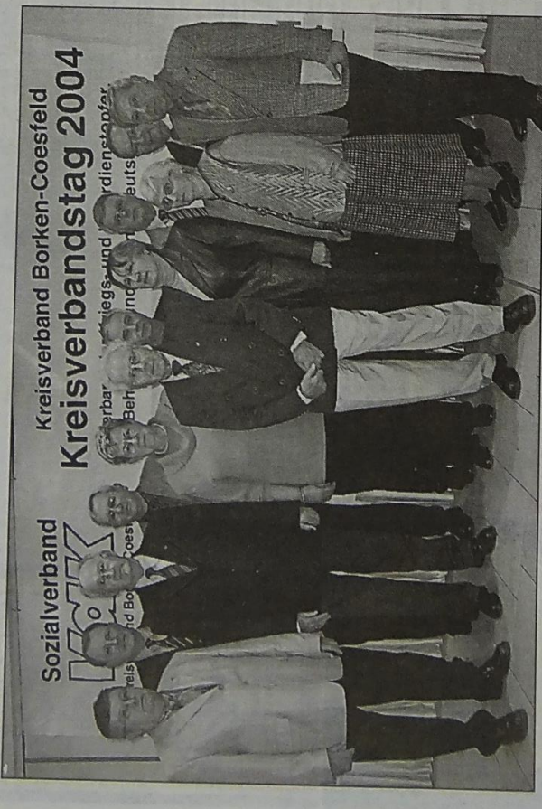
Der neue Vorstand des Sozialverbandes VDK, der bei der Kreisversammlung in Legden gewählt wurde.