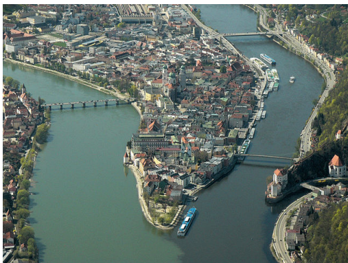
Luftbild von Passau, Deutschland

Zur Sommersonnenwende war nun seine Reisegruppe im Rahmen einer Flusskreuzfahrt auf der Donau und damit auf der "Königin der Flüsse" für eine Woche lang vom 17.06. bis 23.06.2018 durch Niederbayern, die Slowakei, Österreich und Ungarn unterwegs.