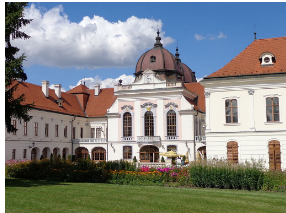
Grassalkovich-kastély (melléképület) 2012-ben

Am nächsten Vormittag erreichte man die ungarische Metropole Budapest, in der die Matthiaskirche, Fischerbastei, Dom, die berühmte Kettenbrücke und der Gellertberg mit Freiheitsstatue die siegerländer „VdK'ler“ erwarteten.