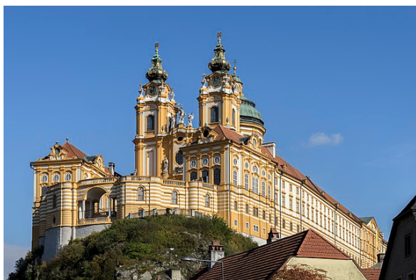
Stift Melk, Westansicht

Mit der Anlandung in Wien wurde ein ganztägiger Aufenthalt verbunden. Der Weg führte weiter in das niederösterreichische Dürnstein.