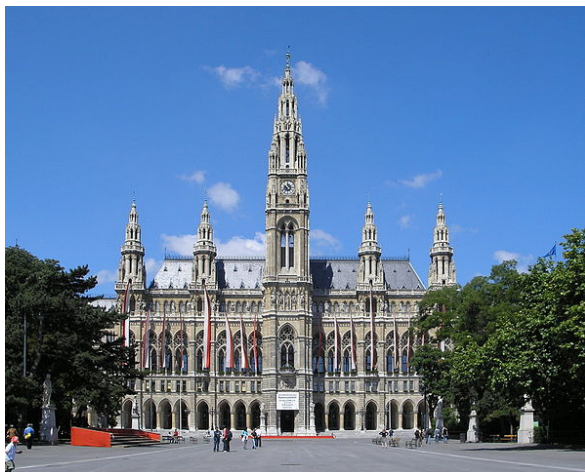
Rathaus Vienna June 2006 165

Zurück ging es nun wieder über die österreichische Staatsgrenze bis zum nächsten Ziel.