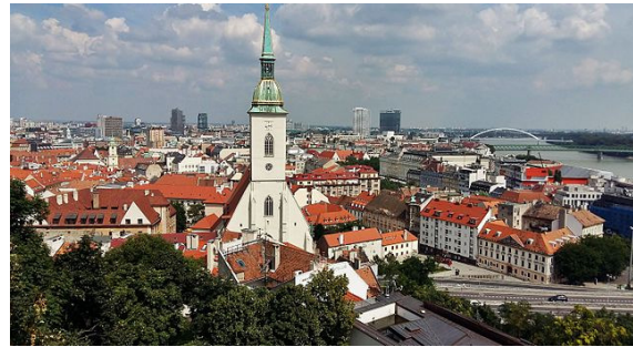
Bratislava Cityscape

In Bratislava wurde als erstes angelegt. Die slowakische Hauptstadt wurde im Zuge einer Stadtführung ausgiebig erkundet.