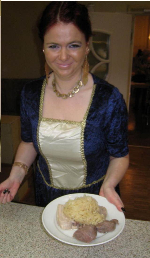
VdK-Schlachtfest 2018 am 10.2. Fastnachtssamstag