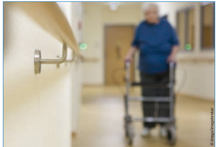
Die Pflege im Heim wird für die Bewohner immer teurer. Ein Grund sind die gestiegenen Investitionskosten.

Um eine angemessene pflegerische Infrastruktur zu gewährleisten, sind die Bundesländer nach § 9 Sozialgesetzbuch XI verpflichtet, sich an den Investitionskosten für Pflegeeinrichtungen zu beteiligen. Allerdings kommen nur noch wenige Bundesländer dieser Verpflichtung