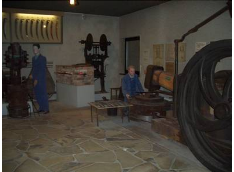
Verschiedene Ausstellungsstücke im Museum