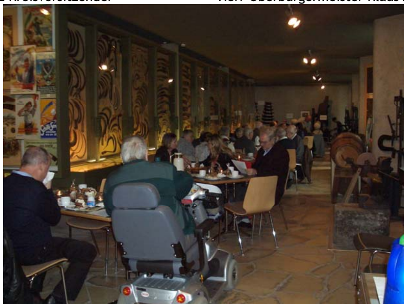
Es waren ca. 50 Besucher anwesend