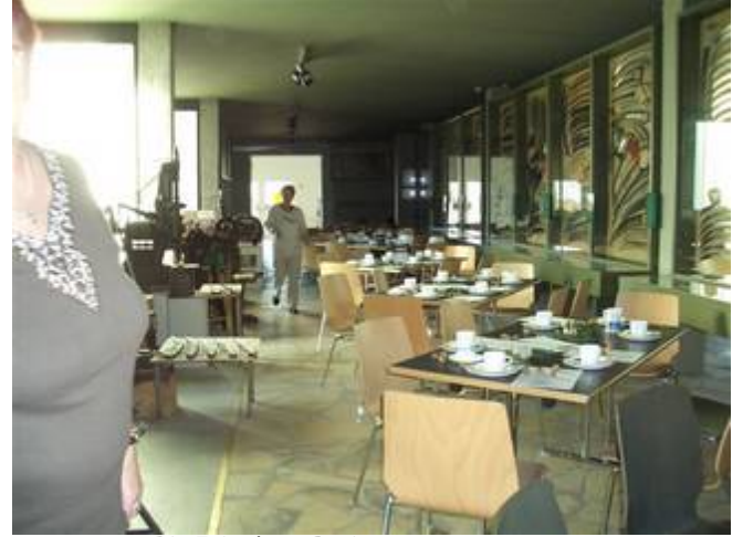
Die Feier kann Beginnen