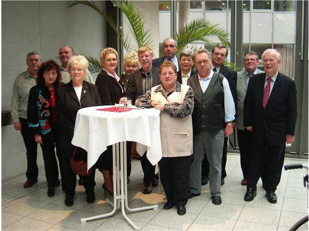
Vertreter aus dem VdK-Bezirksverband Nordthüringen