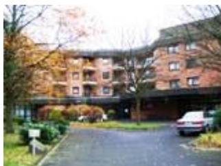
Haus am Landgrafenteich in Bad Salzhausen

Das reichhaltige Angebot der Landeseigenen Ehrenamtsakademie des Landesverbandes Hessen-Thüringen in Nidda – Bad Salzhausen wird durch die Mitglieder der Bezirks-, Kreis- und Ortsverbände gern genutzt. Hier können sie sich das Rüstzeug für ihre Ehrenamtsarbeit holen. Durch den VdK-Kreisverband Sömmerda und deren Ortsverbände wurden die Bildungsangebote genutzt.