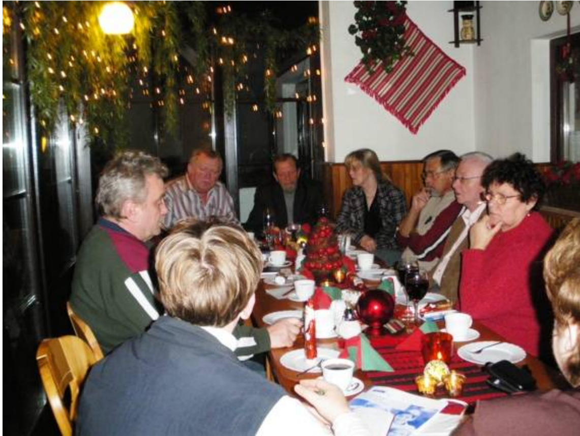
Weihnachtsfeier beim Kreisvorstand Sömmerda 2008