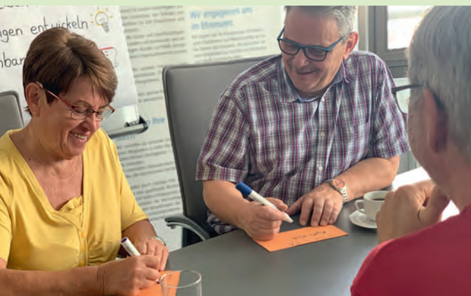
Eine Mediation zeigt Wege aus dem Konflikt.