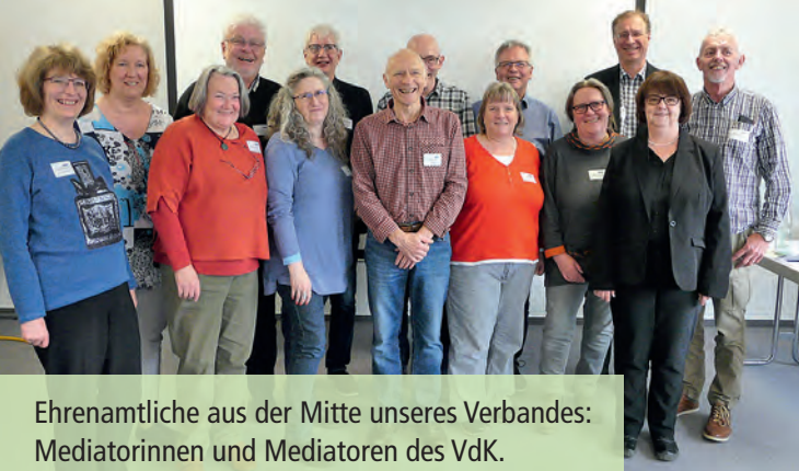
Ehrenamtliche aus der Mitte unseres Verbandes: Mediatorinnen und Mediatoren des VdK.