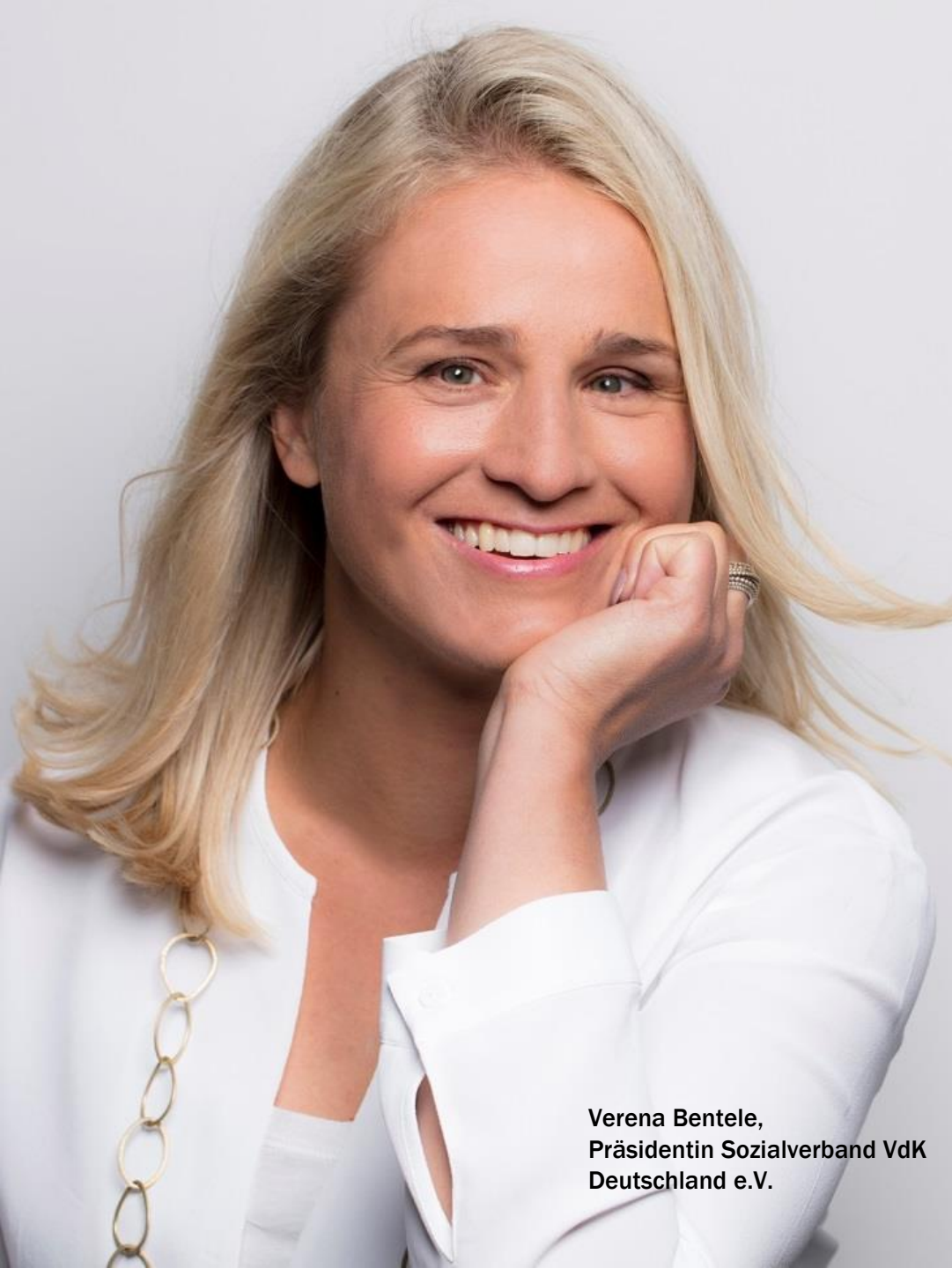
Verena Bentele, Präsidentin Sozialverband VdK Deutschland e.V.