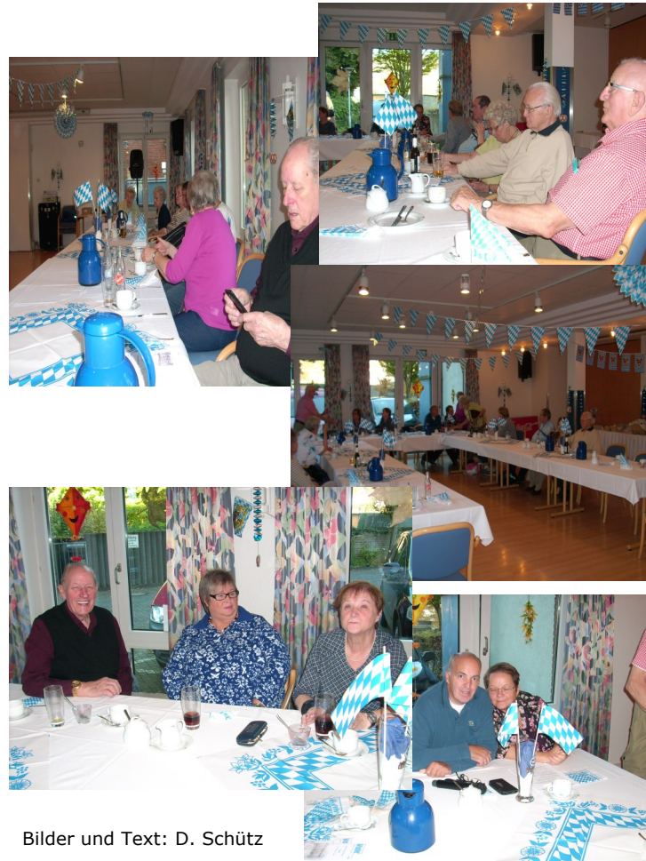
Bilder und Text: D. Schütz

Das Oktoberfest im Wohndorf Laar war für die Mitglieder des VdK ein schöner bunter Nachmittag. Das Essen war gut, die Mitglieder waren zufrieden, und sie freuen sich schon auf das nächste Fest.