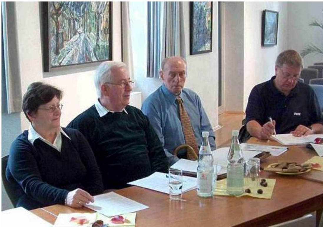
Delegierte aus der Bergarbeiterstadt Roßleben