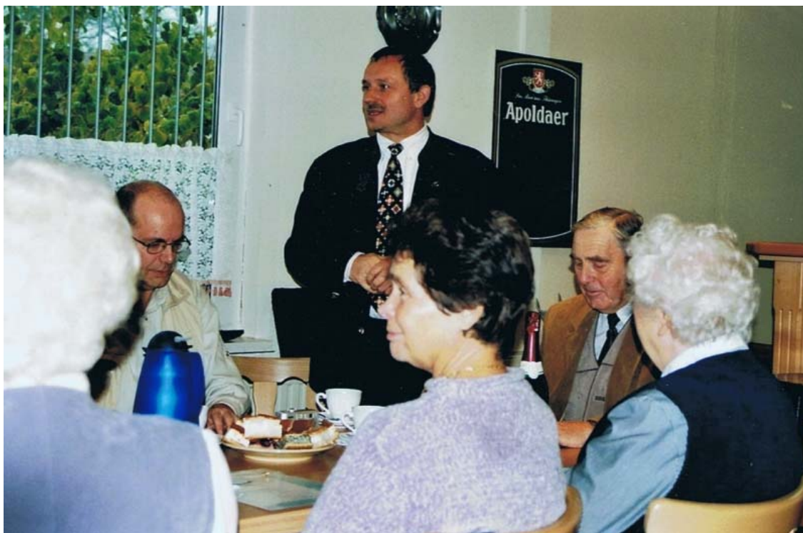
Hier vom stellvertretenden Bürgermeister Wilhelm Schreier...