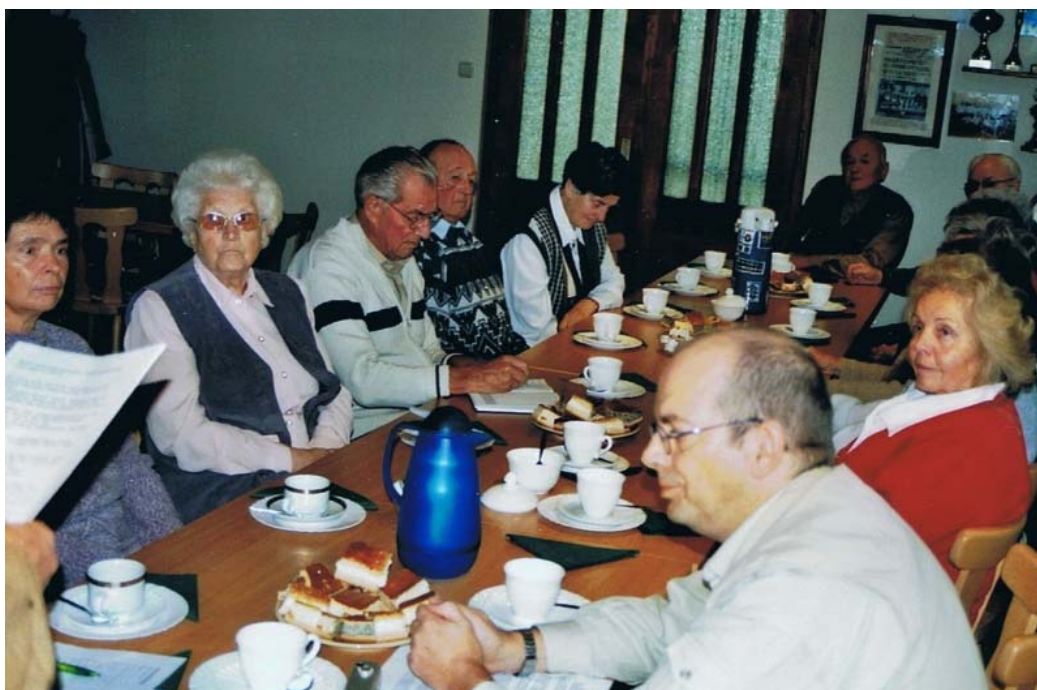
Aufmerksam verfolgen die Mitglieder das Gesagte.