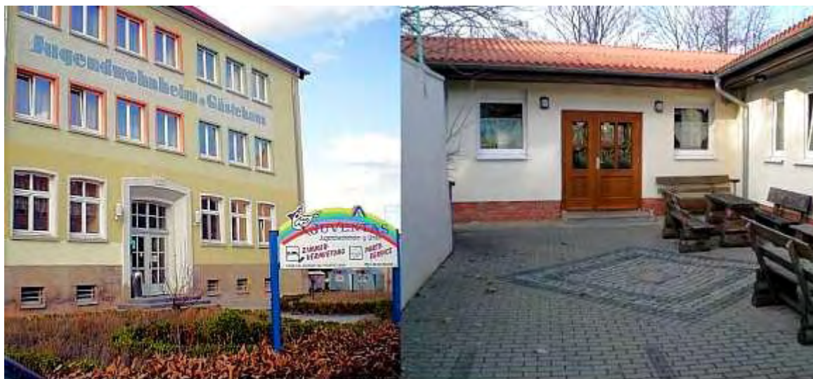
Das Jugendwohnheim (links) und den Saal im Anbau (rechts). Die Mitarbeiter/innen des Hauses waren gute Gastgeber.