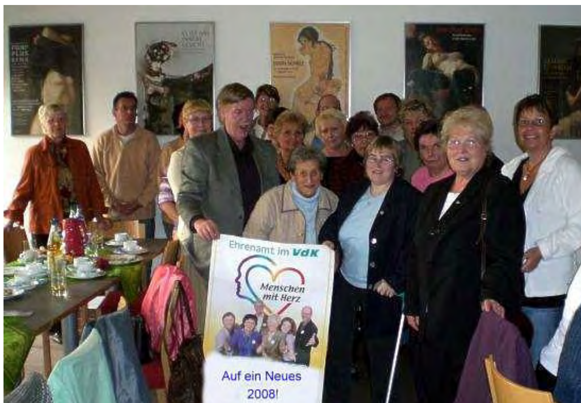
Abschlussfoto, auf dem leider nicht alle Teilnehmerinnen zu sehen sind.