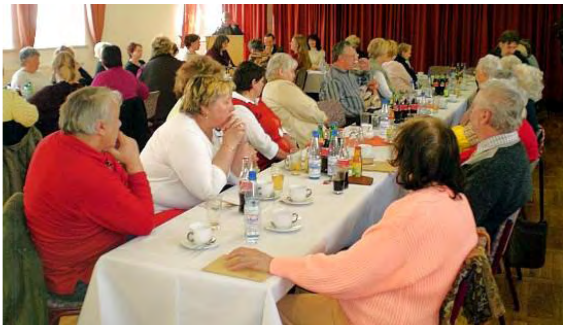
Blick auf die Teilnehmerinnen der Veranstaltung