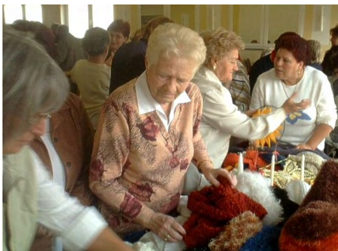
Großes Interesse gab es am Handarbeitsstand