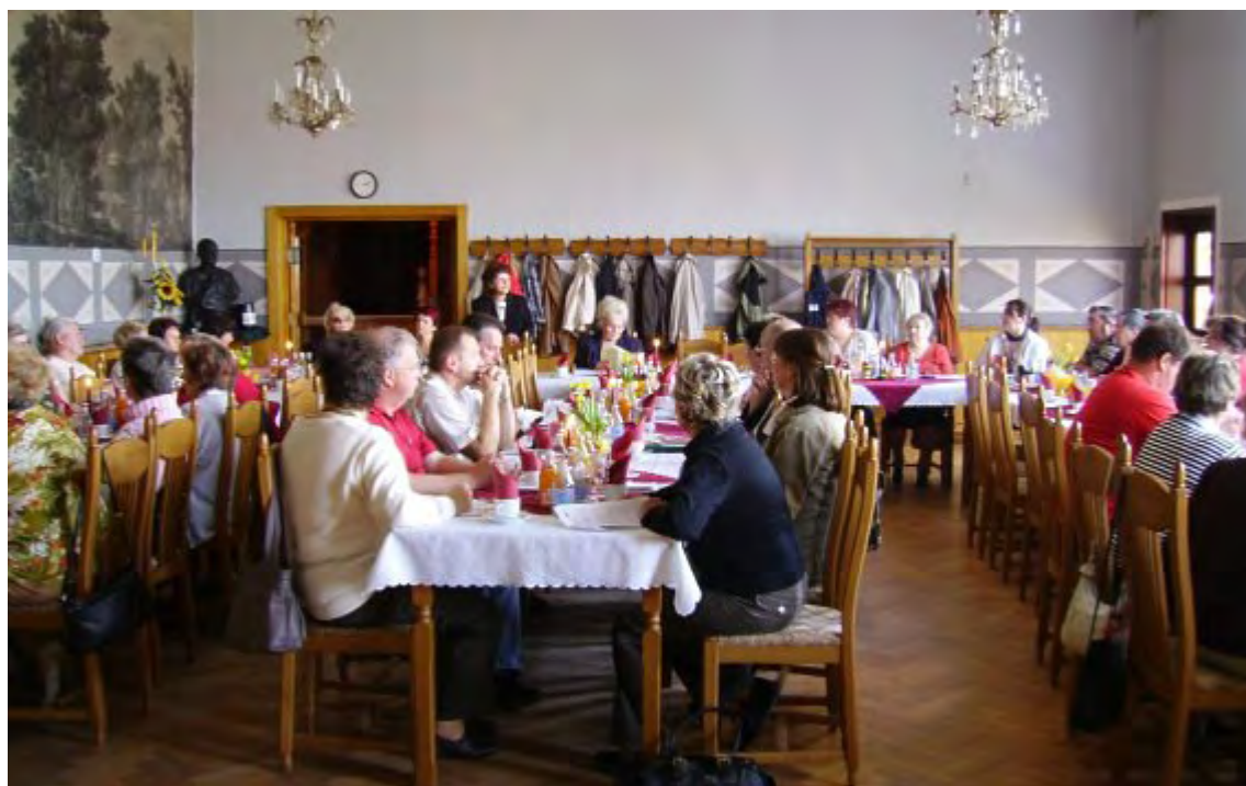
Die Teilnehmer fühlten sich wohl im Waldhaus "Japan"