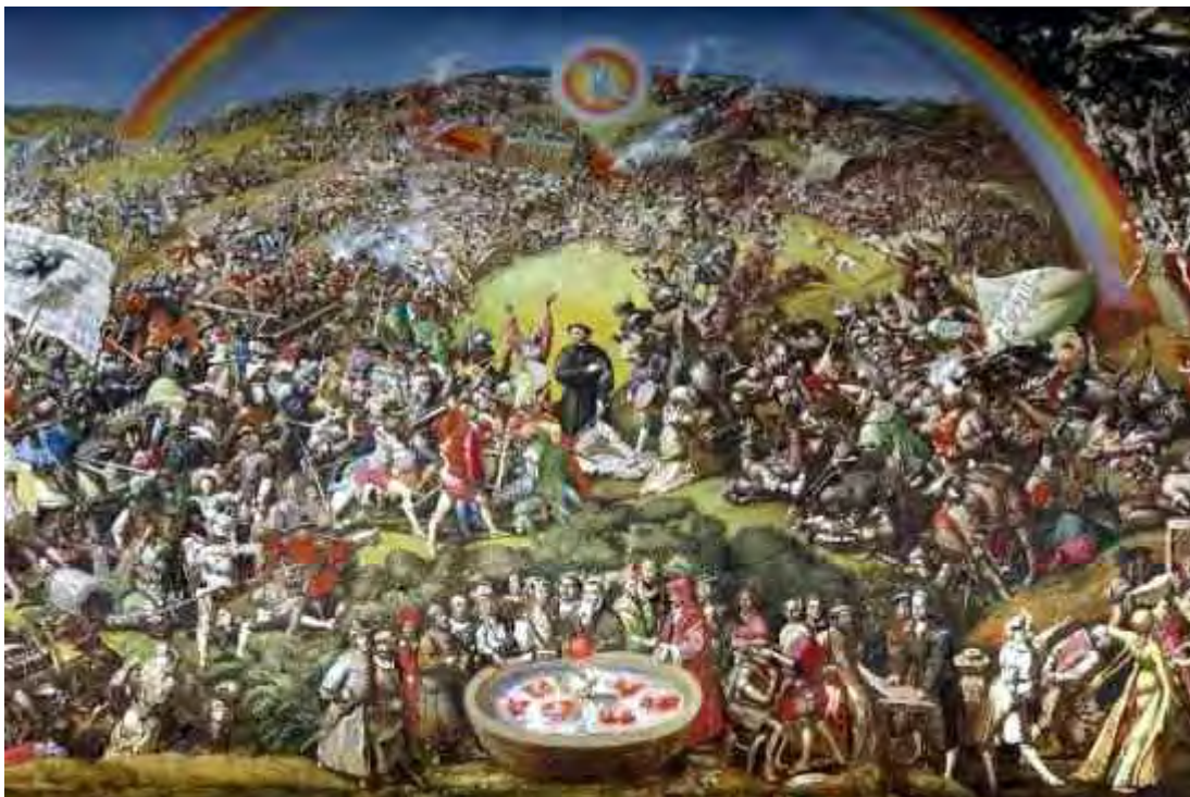
Beeindruckend dann das Panorama-Gemälde von Werner Tübke.