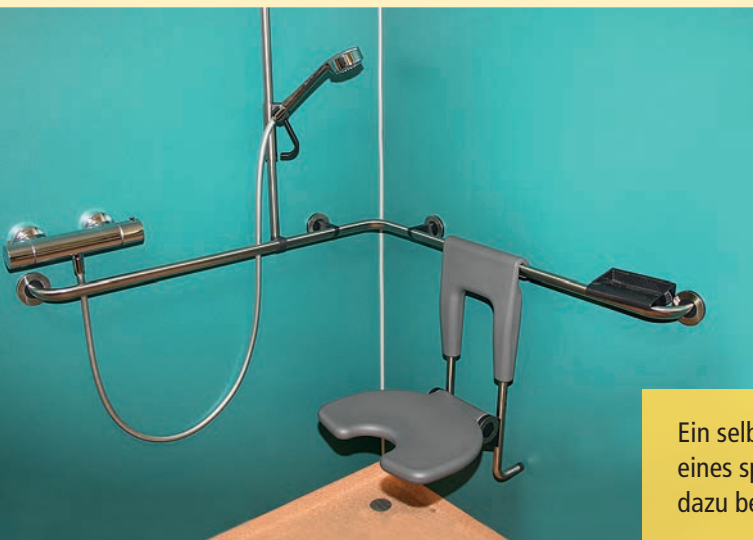
Ein selbständiges Leben führen: Der Einbau eines speziellen Sitzes in der Dusche kann dazu beitragen.

Sicherheit und Lebensqualität in vertrauter Umgebung sind für jeden wichtig. Auch wenn ein Umbau der bestehenden Wohnung erforderlich wird, bietet die VdK-Fachstelle Unterstützung an und hilft Ihnen bei der barrierefreien Umgestaltung Ihres Zuhauses.